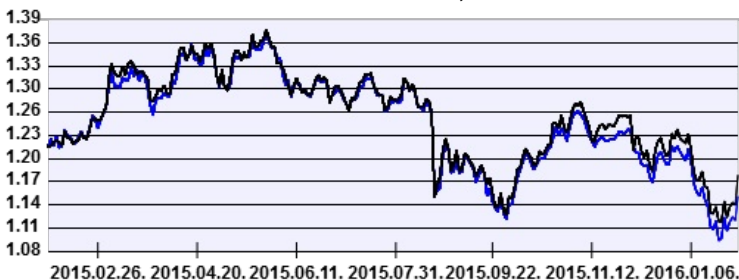
EGY JEGYRE JUTÓ NETTÓ ESZKÖZÉRTÉK, 2015.02.01 - 2016.01.31

— Aegon Climate Change Részvény Befektetési Alap HUF sorozat — Benchmark