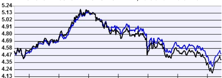
EGY JEGYRE JUTÓ NETTÓ ESZKÖZÉRTÉK, 2015.01.01 - 2015.12.31

— Aegon Közép-Európai Részvény Befektetési Alap intézményi sorozat — Benchmark