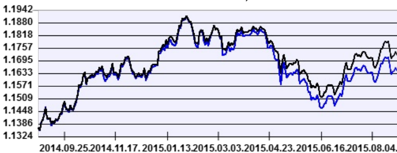
— Aegon Lengyel Kötvény Befektetési Alap intézményi sorozat — Benchmark

A múltbeli hozamok nem jelentenek garanciát az alap jövőbeli teljesítményére nézve. Jelen hirdetés nem minősül ajánlattételnek vagy befektetési tanácsadásnak. A befektetés részletes feltételeit az Alap Tájékoztatója tartalmazza, mely a mindenkor érvényes kondíciós listákkal együtt megtalálható a forgalmazási helyeken. A befektetési alap forgalmazásával (vétel, tartás, eladás) kapcsolatos költségek az alap kezelési szabályzatában és a forgalmazási helyeken megismerhetők.