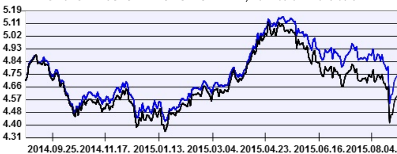
EGY JEGYRE JUTÓ NETTÓ ESZKÖZÉRTÉK, 2014.09.01 - 2015.08.31