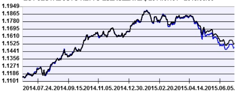
— Aegon Lengyel Kötvény Befektetési Alap intézményi sorozat — Benchmark

A múltbeli hozamok nem jelentenek garanciát az alap jövőbeli teljesítményére nézve. Jelen hirdetés nem minősül ajánlattételnek vagy befektetési tanácsadásnak. A befektetés részletes feltételeit az Alap Tájékoztatója tartalmazza, mely a mindenkor érvényes kondíciós listákkal együtt megtalálható a forgalmazási helyeken. A befektetési alap forgalmazásával (vétel, tartás, eladás) kapcsolatos költségek az alap kezelési szabályzatában és a forgalmazási helyeken megismerhetők.