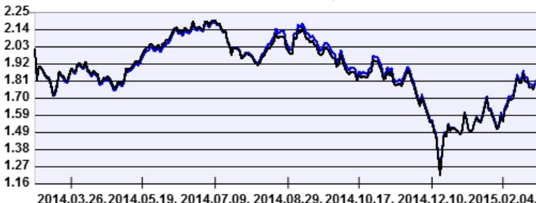
EGY JEGYRE JUTÓ NETTÓ ESZKÖZÉRTÉK, 2014.03.01 - 2015.02.28

— AEGON Russia Részvény Befektetési Alap intézményi sorozat