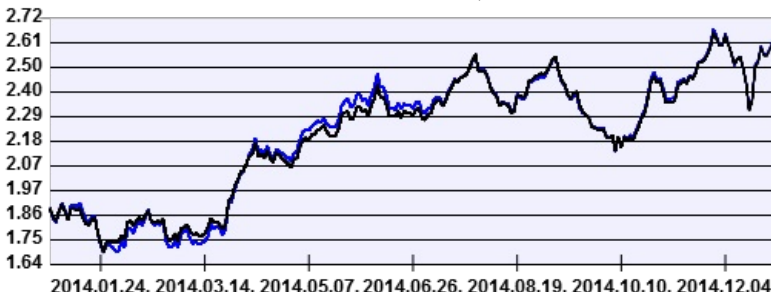
— AEGON IstanBull Részvény Befektetési Alap HUF sorozat — Benchmark

A múltbeli hozamok nem jelentenek garanciát az alap jövőbeli teljesítményére nézve. Jelen hirdetés nem minősül ajánlattételnek vagy befektetési tanácsadásnak. A befektetés részletes feltételeit az Alap Tájékoztatója tartalmazza, mely a mindenkor érvényes kondíciós listákkal együtt megtalálható a forgalmazási helyeken. A befektetési alap forgalmazásával (vétel, tartás, eladás) kapcsolatos költségek az alap kezelési szabályzatában és a forgalmazási helyeken megismerhetők.