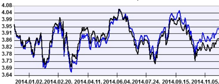
EGY JEGYRE JUTÓ NETTÓ ESZKÖZÉRTÉK, 2013.12.01 - 2014.11.30

— AEGON Közép-Európai Részvény Befektetési Alap EUR sorozat — Benchmark