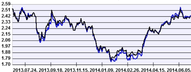
EGY JEGYRE JUTÓ NETTÓ ESZKÖZÉRTÉK, 2013.07.01 - 2014.06.30

— AEGON IstanBull Részvény Befektetési Alap intézményi sorozat