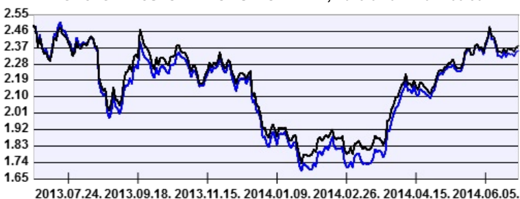
— AEGON IstanBull Részvény Befektetési Alap HUF sorozat — Benchmark

EGY JEGYRE JUTÓ NETTÓ ESZKÖZÉRTÉK, 2013.07.01 - 2014.06.30