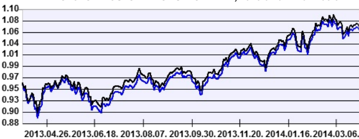
EGY JEGYRE JUTÓ NETTÓ ESZKÖZÉRTÉK, 2013.04.01 - 2014.03.31

A múltbeli hozamok nem jelentenek garanciát az alap jövőbeli teljesítményére nézve. Jelen hirdetés nem minősül ajánlattételnek vagy befektetési tanácsadásnak. A befektetés részletes feltételeit az Alap Tájékoztatója tartalmazza, mely a mindenkor érvényes kondíciós listákkal együtt megtalálható a forgalmazási helyeken. A befektetési alap forgalmazásával (vétel, tartás, eladás) kapcsolatos költségek az alap kezelési szabályzatában és a forgalmazási helyeken megismerhetők.