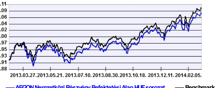
AZ ALAP TELJESÍTMÉNYE AZ ELMÚLT 12 HÓNAPBAN EGY JEGYRE JUTÓ NETTÓ ESZKÖZÉRTÉK, 2013.03.01 - 2014.02.28

— AEGON Nemzetközi Részvény Befektetési Alap HUF sorozat — Benchmark A múltbeli hozamok nem jelentenek garanciát az alap jövőbeli teljesítményére nézve. Jelen hirdetés nem minősül ajánlattételnek vagy befektetési tanácsadásnak. A befektetés részletes feltételeit az Alap Tájékoztatója tartalmazza, mely a mindenkor érvényes kondíciós listákkal együtt megtalálható a forgalmazási helyeken. A befektetési alap forgalmazásával (vétel, tartás, eladás) kapcsolatos költségek az alap kezelési szabályzatában és a forgalmazási helyeken megismerhetők.