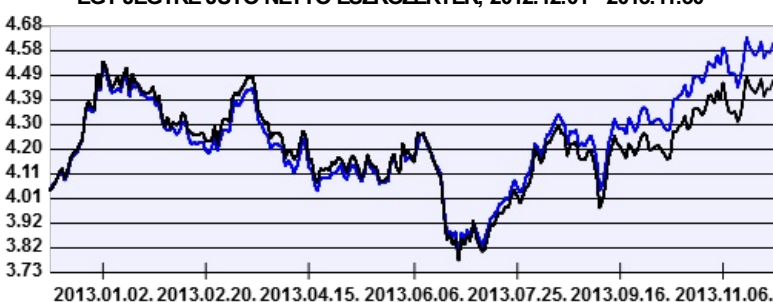
EGY JEGYRE JUTÓ NETTÓ ESZKÖZÉRTÉK, 2012.12.01 - 2013.11.30