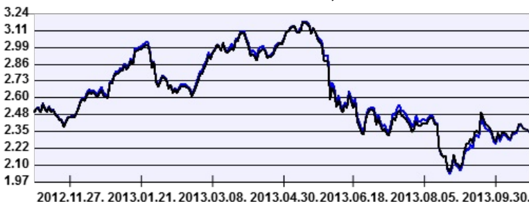
— AEGON IstanBull Részvény Befektetési Alap intézményi sorozat — Benchmark

A múltbeli hozamok nem jelentenek garanciát az alap jövőbeli teljesítményére nézve. Jelen hirdetés nem minősül ajánlattételnek vagy befektetési tanácsadásnak. A befektetés részletes feltételeit az Alap Tájékoztatója tartalmazza, mely a mindenkor érvényes kondíciós listákkal együtt megtalálható a forgalmazási helyeken. A befektetési alap forgalmazásával (vétel, tartás, eladás) kapcsolatos költségek az alap kezelési szabályzatában és a forgalmazási helyeken megismerhetők.