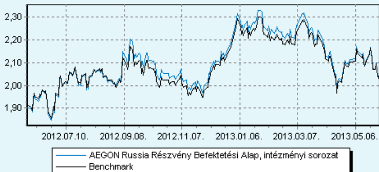
EGY JEGYRE JUTÓ NETTÓ ESZKÖZÉRTÉK, 2012.06.01 - 2013.05.31

A múltbeli hozamok nem jelentenek garanciát az alap jövőbeli teljesítményére nézve. Jelen hirdetés nem minősül ajánlattételnek vagy befektetési tanácsadásnak. A befektetés részletes feltételeit az Alap Tájékoztatója tartalmazza, mely a mindenkor érvényes kondíciós listákkal együtt megtalálható a forgalmazási helyeken. A befektetési alap forgalmazásával (vétel, tartás, eladás) kapcsolatos költségek az alap kezelési szabályzatában és a forgalmazási helyeken megismerhetők.