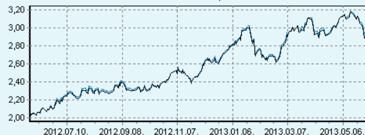
EGY JEGYRE JUTÓ NETTÓ ESZKÖZÉRTÉK, 2012.06.01 - 2013.05.31

A múltbeli hozamok nem jelentenek garanciát az alap jövőbeli teljesítményére nézve. Jelen hirdetés nem minősül ajánlattételnek vagy befektetési tanácsadásnak. A befektetés részletes feltételeit az Alap Tájékoztatója tartalmazza, mely a mindenkor érvényes kondíciós listákkal együtt megtalálható a forgalmazási helyeken. A befektetési alap forgalmazásával (vétel, tartás, eladás) kapcsolatos költségek az alap kezelési szabályzatában és a forgalmazási helyeken megismerhetők.