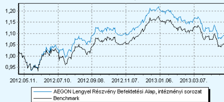
EGY JEGYRE JUTÓ NETTÓ ESZKÖZÉRTÉK, 2012.05.01 - 2013.04.30

Az alapok múltbeli teljesítménye nem nyújt garanciát a jövőbeli hozamok nagyságára. Jelen hirdetés nem minősül ajánlattételnek vagy befektetési tanácsadásnak. A befektetés részletes feltételeit az Alap Tájékoztatója tartalmazza, mely a mindenkor érvényes kondíciós listákkal együtt megtalálható a forgalmazási helyeken. A befektetési alap forgalmazásával (vétel, tartás, eladás) kapcsolatos költségek az alap kezelési szabályzatában és a forgalmazási helyeken megismerhetők.