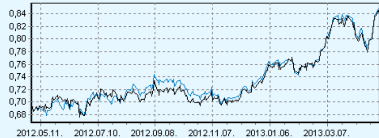
EGY JEGYRE JUTÓ NETTÓ ESZKÖZÉRTÉK, 2012.05.01 - 2013.04.30

— AEGON Climate Change Részvény Befektetési Alap, HUF sorozat — Benchmark