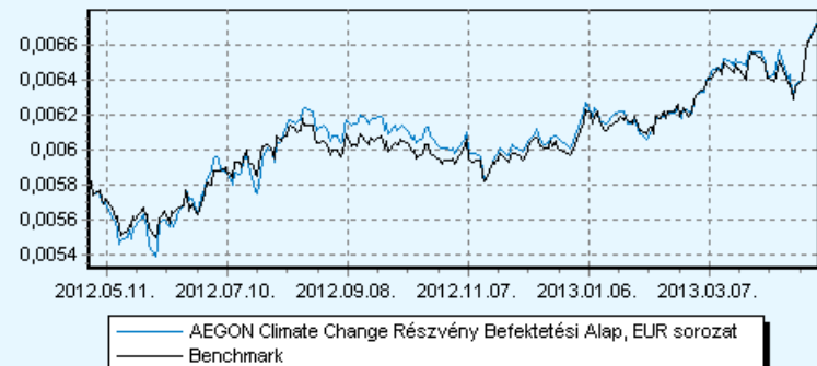
EGY JEGYRE JUTÓ NETTÓ ESZKÖZÉRTÉK, 2012.05.01 - 2013.04.30

Az alapok múltbeli teljesítménye nem nyújt garanciát a jövőbeli hozamok nagyságára. Jelen hirdetés nem minősül ajánlattételnek vagy befektetési tanácsadásnak. A befektetés részletes feltételeit az Alap Tájékoztatója tartalmazza, mely a mindenkor érvényes kondíciók listákkal együtt megtalálható a forgalmazási helyeken. A befektetési alap forgalmazásával (vétel, tartás, eladás) kapcsolatos költségek az alap kezelési szabályzatában és a forgalmazási helyeken megismerhetők.