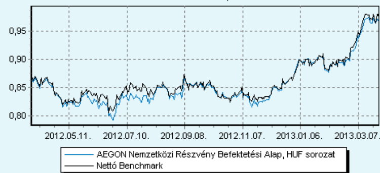
EGY JEGYRE JUTÓ NETTÓ ESZKÖZÉRTÉK, 2012.04.01 - 2013.03.31

Az alapok múltbeli teljesítménye nem nyújt garanciát a jövőbeli hozamok nagyságára. Jelen hirdetés nem minősül ajánlattételnek vagy befektetési tanácsadásnak. A befektetés részletes feltételeit az Alap Tájékoztatója tartalmazza, mely a mindenkor érvényes kondíciós listákkal együtt megtalálható a forgalmazási helyeken. A befektetési alap forgalmazásával (vétel, tartás, eladás) kapcsolatos költségek az alap kezelési szabályzatában és a forgalmazási helyeken megismerhetők.