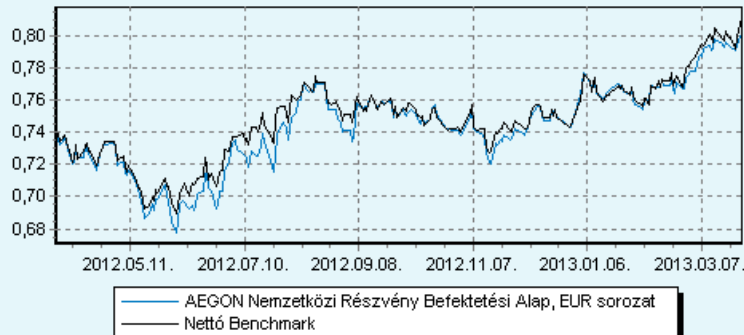
EGY JEGYRE JUTÓ NETTÓ ESZKÖZÉRTÉK, 2012.04.01 - 2013.03.31

Az alapok múltbeli teljesítménye nem nyújt garanciát a jövőbeli hozamok nagyságára. Jelen hirdetés nem minősül ajánlattételnek vagy befektetési tanácsadásnak. A befektetés részletes feltételeit az Alap Tájékoztatója tartalmazza, mely a mindenkor érvényes kondíciós listákkal együtt megtalálható a forgalmazási helyeken. A befektetési alap forgalmazásával (vétel, tartás, eladás) kapcsolatos költségek az alap kezelési szabályzatában és a forgalmazási helyeken megismerhetők.