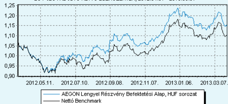
EGY JEGYRE JUTÓ NETTÓ ESZKÖZÉRTÉK, 2012.04.01 - 2013.03.31

Az alapok múltbeli teljesítménye nem nyújt garanciát a jövőbeli hozamok nagyságára. Jelen hirdetés nem minősül ajánlattételnek vagy befektetési tanácsadásnak. A befektetés részletes feltételeit az Alap Tájékoztatója tartalmazza, mely a mindenkor érvényes kondíciós listákkal együtt megtalálható a forgalmazási helyeken. A befektetési alap forgalmazásával (vétel, tartás, eladás) kapcsolatos költségek az alap kezelési szabályzatában és a forgalmazási helyeken megismerhetők.