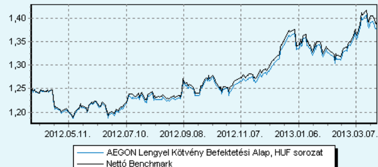
EGY JEGYRE JUTÓ NETTÓ ESZKÖZÉRTÉK, 2012.04.01 - 2013.03.31

Az alapok múltbeli teljesítménye nem nyújt garanciát a jövőbeli hozamok nagyságára. Jelen hirdetés nem minősül ajánlattételnek vagy befektetési tanácsadásnak. A befektetés részletes feltételeit az Alap Tájékoztatója tartalmazza, mely a mindenkor érvényes kondíciós listákkal együtt megtalálható a forgalmazási helyeken. A befektetési alap forgalmazásával (vétel, tartás, eladás) kapcsolatos költségek az alap kezelési szabályzatában és a forgalmazási helyeken megismerhetők.