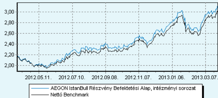
EGY JEGYRE JUTÓ NETTÓ ESZKÖZÉRTÉK, 2012.04.01 - 2013.03.31

Az alapok múltbeli teljesítménye nem nyújt garanciát a jövőbeli hozamok nagyságára. Jelen hirdetés nem minősül ajánlattételnek vagy befektetési tanácsadásnak. A befektetés részletes feltételeit az Alap Tájékoztatója tartalmazza, mely a mindenkor érvényes kondíciós listákkal együtt megtalálható a forgalmazási helyeken. A befektetési alap forgalmazásával (vétel, tartás, eladás) kapcsolatos költségek az alap kezelési szabályzatában és a forgalmazási helyeken megismerhetők.