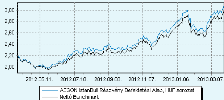
EGY JEGYRE JUTÓ NETTÓ ESZKÖZÉRTÉK, 2012.04.01 - 2013.03.31

Az alapok múltbeli teljesítménye nem nyújt garanciát a jövőbeli hozamok nagyságára. Jelen hirdetés nem minősül ajánlattételnek vagy befektetési tanácsadásnak. A befektetés részletes feltételeit az Alap Tájékoztatója tartalmazza, mely a mindenkor érvényes kondíciós listákkal együtt megtalálható a forgalmazási helyeken. A befektetési alap forgalmazásával (vétel, tartás, eladás) kapcsolatos költségek az alap kezelési szabályzatában és a forgalmazási helyeken megismerhetők.