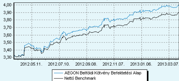
EGY JEGYRE JUTÓ NETTÓ ESZKÖZÉRTÉK, 2012.04.01 - 2013.03.31

Az alapok múltbeli teljesítménye nem nyújt garanciát a jövőbeli hozamok nagyságára. Jelen hirdetés nem minősül ajánlattételnek vagy befektetési tanácsadásnak. A befektetés részletes feltételeit az Alap Tájékoztatója tartalmazza, mely a mindenkor érvényes kondíciós listákkal együtt megtalálható a forgalmazási helyeken. A befektetési alap forgalmazásával (vétel, tartás, eladás) kapcsolatos költségek az alap kezelési szabályzatában és a forgalmazási helyeken megismerhetők.