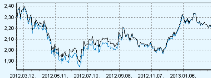
EGY JEGYRE JUTÓ NETTÓ ESZKÖZÉRTÉK, 2012.02.29 - 2013.02.28

— AEGON Russia Részvény Befektetési Alap, intézményi sorozat — Nettó Benchmark