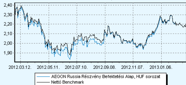
EGY JEGYRE JUTÓ NETTÓ ESZKÖZÉRTÉK, 2012.02.29 - 2013.02.28

Az alapok múltbeli teljesítménye nem nyújt garanciát a jövőbeli hozamok nagyságára. Jelen hirdetés nem minősül ajánlattételnek vagy befektetési tanácsadásnak. A befektetés részletes feltételeit az Alap Tájékoztatója tartalmazza, mely a mindenkor érvényes kondíciós listákkal együtt megtalálható a forgalmazási helyeken. A befektetési alap forgalmazásával (vétel, tartás, eladás) kapcsolatos költségek az alap kezelési szabályzatában és a forgalmazási helyeken megismerhetők.