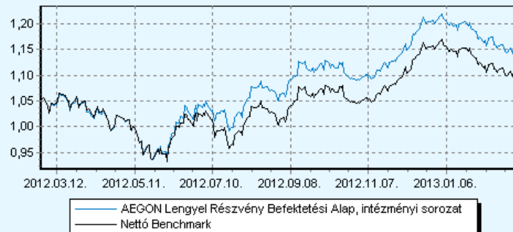
EGY JEGYRE JUTÓ NETTÓ ESZKÖZÉRTÉK, 2012.02.29 - 2013.02.28

Az alapok múltbeli teljesítménye nem nyújt garanciát a jövőbeli hozamok nagyságára. Jelen hirdetés nem minősül ajánlattételnek vagy befektetési tanácsadásnak. A befektetés részletes feltételeit az Alap Tájékoztatója tartalmazza, mely a mindenkor érvényes kondíciós listákkal együtt megtalálható a forgalmazási helyeken. A befektetési alap forgalmazásával (vétel, tartás, eladás) kapcsolatos költségek az alap kezelési szabályzatában és a forgalmazási helyeken megismerhetők.