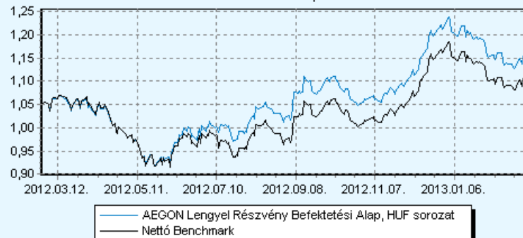
EGY JEGYRE JUTÓ NETTÓ ESZKÖZÉRTÉK, 2012.02.29 - 2013.02.28

Az alapok múltbeli teljesítménye nem nyújt garanciát a jövőbeli hozamok nagyságára. Jelen hirdetés nem minősül ajánlattételnek vagy befektetési tanácsadásnak. A befektetés részletes feltételeit az Alap Tájékoztatója tartalmazza, mely a mindenkor érvényes kondíciós listákkal együtt megtalálható a forgalmazási helyeken. A befektetési alap forgalmazásával (vétel, tartás, eladás) kapcsolatos költségek az alap kezelési szabályzatában és a forgalmazási helyeken megismerhetők.