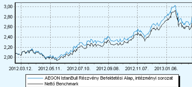
EGY JEGYRE JUTÓ NETTÓ ESZKÖZÉRTÉK, 2012.02.29 - 2013.02.28

Az alapok múltbéli teljesítménye nem nyújt garanciát a jövőbeli hozamok nagyságára. Jelen hirdetés nem minősül ajánlattételnek vagy befektetési tanácsadásnak. A befektetés részletes feltételeit az Alap Tájékoztatója tartalmazza, mely a mindenkor érvényes kondíciós listákkal együtt megtalálható a forgalmazási helyeken. A befektetési alap forgalmazásával (vétel, tartás, eladás) kapcsolatos költségek az alap kezelési szabályzatában és a forgalmazási helyeken megismerhetők.