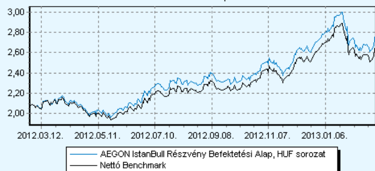
EGY JEGYRE JUTÓ NETTÓ ESZKÖZÉRTÉK, 2012.02.29 - 2013.02.28

Az alapok múltbeli teljesítménye nem nyújt garanciát a jövőbeli hozamok nagyságára. Jelen hirdetés nem minősül ajánlattételnek vagy befektetési tanácsadásnak. A befektetés részletes feltételeit az Alap Tájékoztatója tartalmazza, mely a mindenkor érvényes kondíciós listákkal együtt megtalálható a forgalmazási helyeken. A befektetési alap forgalmazásával (vétel, tartás, eladás) kapcsolatos költségek az alap kezelési szabályzatában és a forgalmazási helyeken megismerhetők.