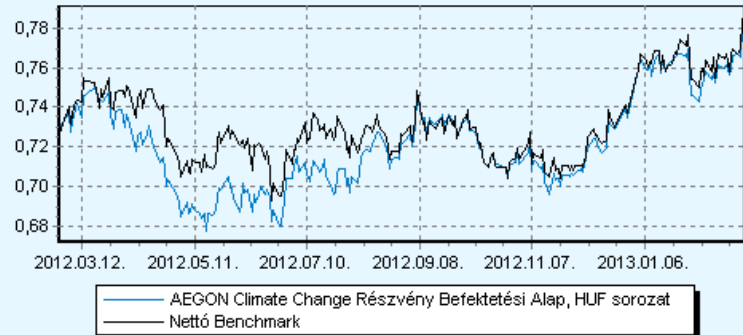
EGY JEGYRE JUTÓ NETTÓ ESZKÖZÉRTÉK, 2012.02.29 - 2013.02.28

Az alapok múltbeli teljesítménye nem nyújt garanciát a jövőbeli hozamok nagyságára. Jelen hirdetés nem minősül ajánlattételnek vagy befektetési tanácsadásnak. A befektetés részletes feltételeit az Alap Tájékoztatója tartalmazza, mely a mindenkor érvényes kondíciós listákkal együtt megtalálható a forgalmazási helyeken. A befektetési alap forgalmazásával (vétel, tartás, eladás) kapcsolatos költségek az alap kezelési szabályzatában és a forgalmazási helyeken megismerhetők.