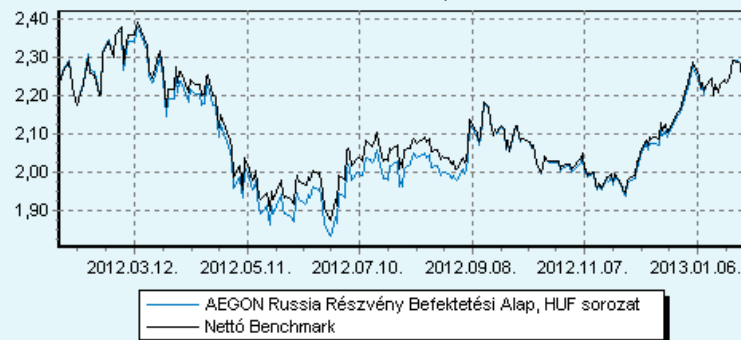
EGY JEGYRE JUTÓ NETTÓ ESZKÖZÉRTÉK, 2012.02.01 - 2013.01.31

Az alapok múltbeli teljesítménye nem nyújt garanciát a jövőbeli hozamok nagyságára. Jelen hirdetés nem minősül ajánlattételnek vagy befektetési tanácsadásnak. A befektetés részletes feltételeit az Alap Tájékoztatója tartalmazza, mely a mindenkor érvényes kondíciós listákkal együtt megtalálható a forgalmazási helyeken. A befektetési alap forgalmazásával (vétel, tartás, eladás) kapcsolatos költségek az alap kezelési szabályzatában és a forgalmazási helyeken megismerhetők.