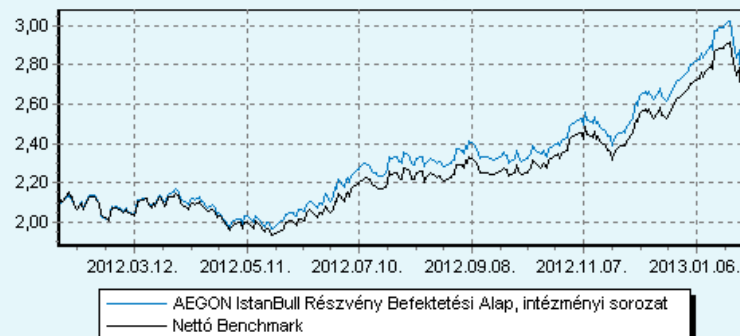
EGY JEGYRE JUTÓ NETTÓ ESZKÖZÉRTÉK, 2012.02.01 - 2013.01.31

Az alapok múltbeli teljesítménye nem nyújt garanciát a jövőbeli hozamok nagyságára. Jelen hirdetés nem minősül ajánlattételnek vagy befektetési tanácsadásnak. A befektetés részletes feltételeit az Alap Tájékoztatója tartalmazza, mely a mindenkor érvényes kondíciós listákkal együtt megtalálható a forgalmazási helyeken. A befektetési alap forgalmazásával (vétel, tartás, eladás) kapcsolatos költségek az alap kezelési szabályzatában és a forgalmazási helyeken megismerhetők.