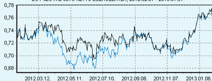
EGY JEGYRE JUTÓ NETTÓ ESZKÖZÉRTÉK, 2012.02.01 - 2013.01.31

Az alapok múltbeli teljesítménye nem nyújt garanciát a jövőbeli hozamok nagyságára. Jelen hirdetés nem minősül ajánlattételnek vagy befektetési tanácsadásnak. A befektetés részletes feltételeit az Alap Tájékoztatója tartalmazza, mely a mindenkor érvényes kondíciós listákkal együtt megtalálható a forgalmazási helyeken. A befektetési alap forgalmazásával (vétel, tartás, eladás) kapcsolatos költségek az alap kezelési szabályzatában és a forgalmazási helyeken megismerhetők.