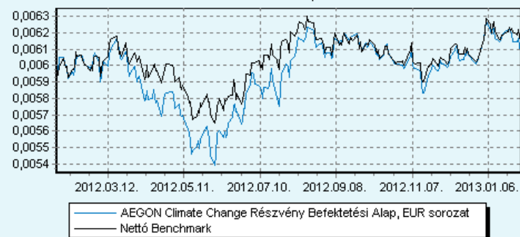
EGY JEGYRE JUTÓ NETTÓ ESZKÖZÉRTÉK, 2012.02.01 - 2013.01.31

Az alapok múltbeli teljesítménye nem nyújt garanciát a jövőbeli hozamok nagyságára. Jelen hirdetés nem minősül ajánlattételnek vagy befektetési tanácsadásnak. A befektetés részletes feltételeit az Alap Tájékoztatója tartalmazza, mely a mindenkor érvényes kondíciós listákkal együtt megtalálható a forgalmazási helyeken. A befektetési alap forgalmazásával (vétel, tartás, eladás) kapcsolatos költségek az alap kezelési szabályzatában és a forgalmazási helyeken megismerhetők.