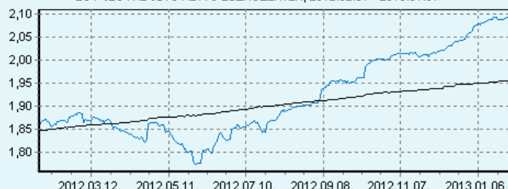
EGY JEGYRE JUTÓ NETTÓ ESZKÖZÉRTÉK, 2012.02.01 - 2013.01.31

Az alapok múltbeli teljesítménye nem nyújt garanciát a jövőbeli hozamok nagyságára. Jelen hirdetés nem minősül ajánlattételnek vagy befektetési tanácsadásnak. A befektetés részletes feltételeit az Alap Tájékoztatója tartalmazza, mely a mindenkor érvényes kondíciós listákkal együtt megtalálható a forgalmazási helyeken. A befektetési alap forgalmazásával (vétel, tartás, eladás) kapcsolatos költségek az alap kezelési szabályzatában és a forgalmazási helyeken megismerhetők.