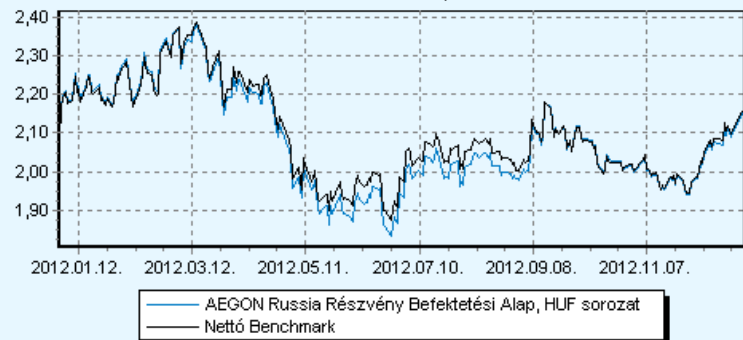
EGY JEGYRE JUTÓ NETTÓ ESZKÖZÉRTÉK, 2012.01.01 - 2012.12.31

Az alapok múltbeli teljesítménye nem nyújt garanciát a jövőbeli hozamok nagyságára. Jelen hirdetés nem minősül ajánlattételnek vagy befektetési tanácsadásnak. A befektetés részletes feltételeit az Alap Tájékoztatója tartalmazza, mely a mindenkor érvényes kondíciós listákkal együtt megtalálható a forgalmazási helyeken. A befektetési alap forgalmazásával (vétel, tartás, eladás) kapcsolatos költségek az alap kezelési szabályzatában és a forgalmazási helyeken megismerhetők.