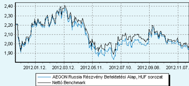
EGY JEGYRE JUTÓ NETTÓ ESZKÖZÉRTÉK, 2011.12.01 - 2012.11.30

Az alapok múltbeli teljesítménye nem nyújt garanciát a jövőbeli hozamok nagyságára. Jelen hirdetés nem minősül ajánlattételnek vagy befektetési tanácsadásnak. A befektetés részletes feltételeit az Alap Tájékoztatója tartalmazza, mely a mindenkor érvényes kondíciós listákkal együtt megtalálható a forgalmazási helyeken. A befektetési alap forgalmazásával (vétel, tartás, eladás) kapcsolatos költségek az alap kezelési szabályzatában és a forgalmazási helyeken megismerhetők.