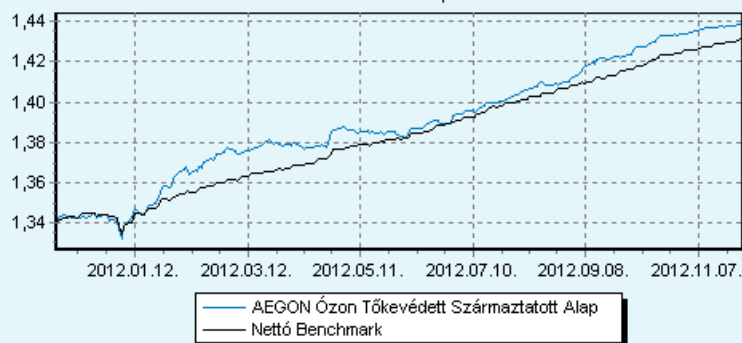
EGY JEGYRE JUTÓ NETTÓ ESZKÖZÉRTÉK, 2011.12.01 - 2012.11.30

Az alapok múltbeli teljesítménye nem nyújt garanciát a jövőbeli hozamok nagyságára. Jelen hirdetés nem minősül ajánlattételnek vagy befektetési tanácsadásnak. A befektetés részletes feltételeit az Alap Tájékoztatója tartalmazza, mely a mindenkor érvényes kondíciós listákkal együtt megtalálható a forgalmazási helyeken. A befektetési alap forgalmazásával (vétel, tartás, eladás) kapcsolatos költségek az alap kezelési szabályzatában és a forgalmazási helyeken megismerhetők.