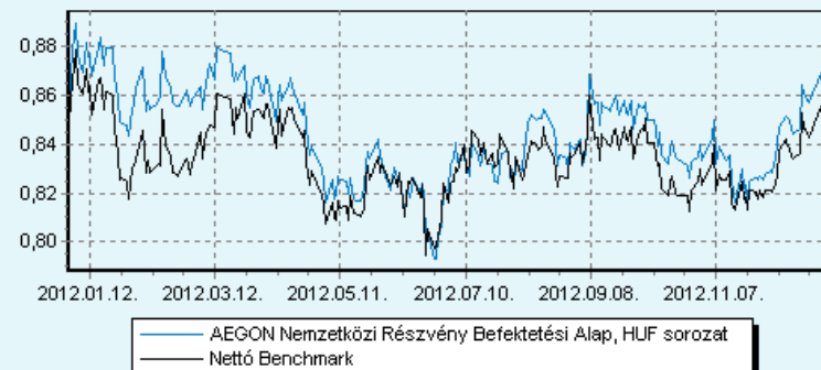
EGY JEGYRE JUTÓ NETTÓ ESZKÖZÉRTÉK, 2012.01.01 - 2012.12.31

Az alapok múltbeli teljesítménye nem nyújt garanciát a jövőbeli hozamok nagyságára. Jelen hirdetés nem minősül ajánlattételnek vagy befektetési tanácsadásnak. A befektetés részletes feltételeit az Alap Tájékoztatója tartalmazza, mely a mindenkor érvényes kondíciós listákkal együtt megtalálható a forgalmazási helyeken. A befektetési alap forgalmazásával (vétel, tartás, eladás) kapcsolatos költségek az alap kezelési szabályzatában és a forgalmazási helyeken megismerhetők.