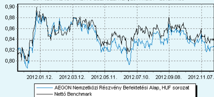
EGY JEGYRE JUTÓ NETTÓ ESZKÖZÉRTÉK, 2011.12.01 - 2012.11.30

Az alapok múltbeli teljesítménye nem nyújt garanciát a jövőbeli hozamok nagyságára. Jelen hirdetés nem minősül ajánlattételnek vagy befektetési tanácsadásnak. A befektetés részletes feltételeit az Alap Tájékoztatója tartalmazza, mely a mindenkor érvényes kondíciós listákkal együtt megtalálható a forgalmazási helyeken. A befektetési alap forgalmazásával (vétel, tartás, eladás) kapcsolatos költségek az alap kezelési szabályzatában és a forgalmazási helyeken megismerhetők.