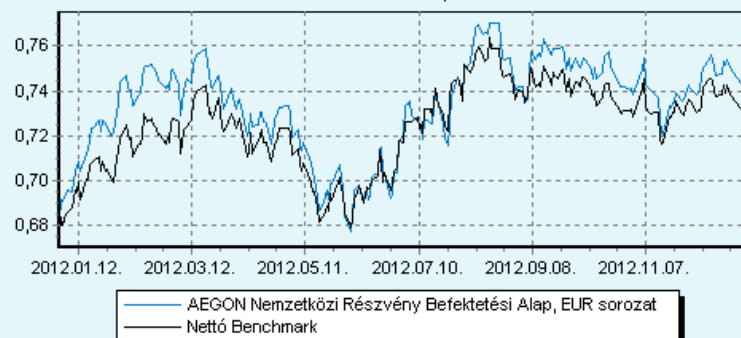
EGY JEGYRE JUTÓ NETTÓ ESZKÖZÉRTÉK, 2012.01.01 - 2012.12.31

Az alapok múltbeli teljesítménye nem nyújt garanciát a jövőbeli hozamok nagyságára. Jelen hirdetés nem minősül ajánlattételnek vagy befektetési tanácsadásnak. A befektetés részletes feltételeit az Alap Tájékoztatója tartalmazza, mely a mindenkor érvényes kondíciós listákkal együtt megtalálható a forgalmazási helyeken. A befektetési alap forgalmazásával (vétel, tartás, eladás) kapcsolatos költségek az alap kezelési szabályzatában és a forgalmazási helyeken megismerhetők.