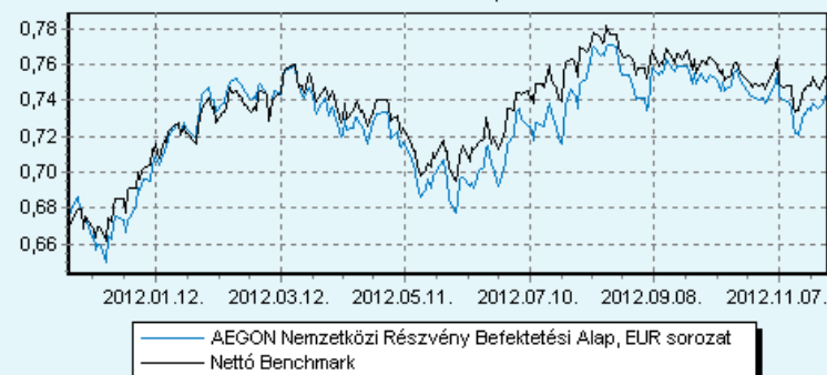
EGY JEGYRE JUTÓ NETTÓ ESZKÖZÉRTÉK, 2011.12.01 - 2012.11.30

Az alapok múltbeli teljesítménye nem nyújt garanciát a jövőbeli hozamok nagyságára. Jelen hirdetés nem minősül ajánlattételnek vagy befektetési tanácsadásnak. A befektetés részletes feltételeit az Alap Tájékoztatója tartalmazza, mely a mindenkor érvényes kondíciós listákkal együtt megtalálható a forgalmazási helyeken. A befektetési alap forgalmazásával (vétel, tartás, eladás) kapcsolatos költségek az alap kezelési szabályzatában és a forgalmazási helyeken megismerhetők.