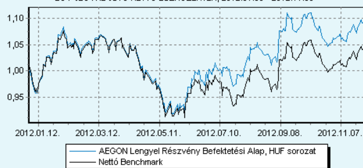
EGY JEGYRE JUTÓ NETTÓ ESZKÖZÉRTÉK, 2012.01.03 - 2012.11.30

Az alapok múltbeli teljesítménye nem nyújt garanciát a jövőbeli hozamok nagyságára. Jelen hirdetés nem minősül ajánlattételnek vagy befektetési tanácsadásnak. A befektetés részletes feltételeit az Alap Tájékoztatója tartalmazza, mely a mindenkor érvényes kondíciós listákkal együtt megtalálható a forgalmazási helyeken. A befektetési alap forgalmazásával (vétel, tartás, eladás) kapcsolatos költségek az alap kezelési szabályzatában és a forgalmazási helyeken megismerhetők.