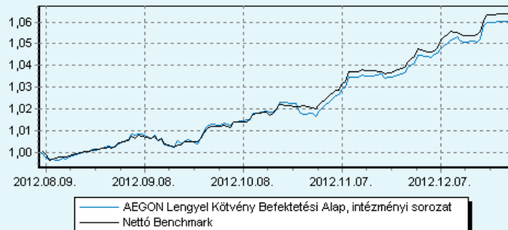
EGY JEGYRE JUTÓ NETTÓ ESZKÖZÉRTÉK, 2012.08.07 - 2012.12.31

Az alapok múltbeli teljesítménye nem nyújt garanciát a jövőbeli hozamok nagyságára. Jelen hirdetés nem minősül ajánlattételnek vagy befektetési tanácsadásnak. A befektetés részletes feltételeit az Alap Tájékoztatója tartalmazza, mely a mindenkor érvényes kondíciós listákkal együtt megtalálható a forgalmazási helyeken. A befektetési alap forgalmazásával (vétel, tartás, eladás) kapcsolatos költségek az alap kezelési szabályzatában és a forgalmazási helyeken megismerhetők.