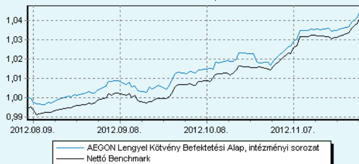
EGY JEGYRE JUTÓ NETTÓ ESZKÖZÉRTÉK, 2012.08.07 - 2012.11.30

Az alapok múltbeli teljesítménye nem nyújt garanciát a jövőbeli hozamok nagyságára. Jelen hirdetés nem minősül ajánlattételnek vagy befektetési tanácsadásnak. A befektetés részletes feltételeit az Alap Tájékoztatója tartalmazza, mely a mindenkor érvényes kondíciós listákkal együtt megtalálható a forgalmazási helyeken. A befektetési alap forgalmazásával (vétel, tartás, eladás) kapcsolatos költségek az alap kezelési szabályzatában és a forgalmazási helyeken megismerhetők.