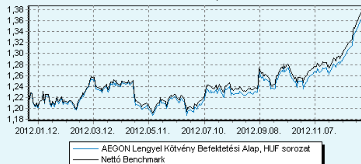
EGY JEGYRE JUTÓ NETTÓ ESZKÖZÉRTÉK, 2012.01.01 - 2012.12.31

Az alapok múltbeli teljesítménye nem nyújt garanciát a jövőbeli hozamok nagyságára. Jelen hirdetés nem minősül ajánlattételnek vagy befektetési tanácsadásnak. A befektetés részletes feltételeit az Alap Tájékoztatója tartalmazza, mely a mindenkor érvényes kondíciós listákkal együtt megtalálható a forgalmazási helyeken. A befektetési alap forgalmazásával (vétel, tartás, eladás) kapcsolatos költségek az alap kezelési szabályzatában és a forgalmazási helyeken megismerhetők.