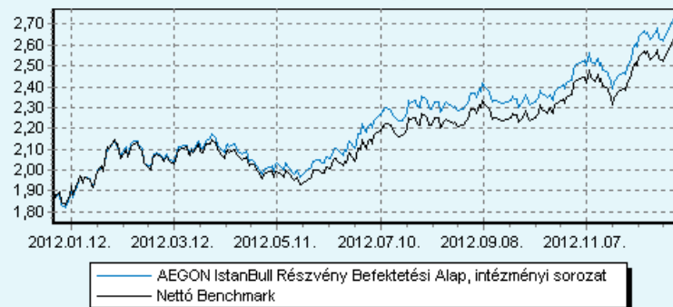
EGY JEGYRE JUTÓ NETTÓ ESZKÖZÉRTÉK, 2012.01.01 - 2012.12.31

Az alapok múltbeli teljesítménye nem nyújt garanciát a jövőbeli hozamok nagyságára. Jelen hirdetés nem minősül ajánlattételnek vagy befektetési tanácsadásnak. A befektetés részletes feltételeit az Alap Tájékoztatója tartalmazza, mely a mindenkor érvényes kondíciós listákkal együtt megtalálható a forgalmazási helyeken. A befektetési alap forgalmazásával (vétel, tartás, eladás) kapcsolatos költségek az alap kezelési szabályzatában és a forgalmazási helyeken megismerhetők.